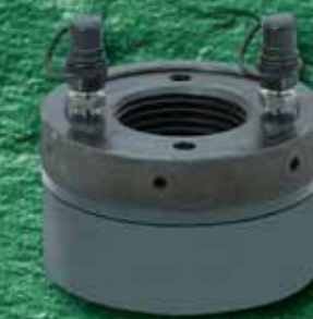
Boltmax tension HN Гидравлические гайки до M100