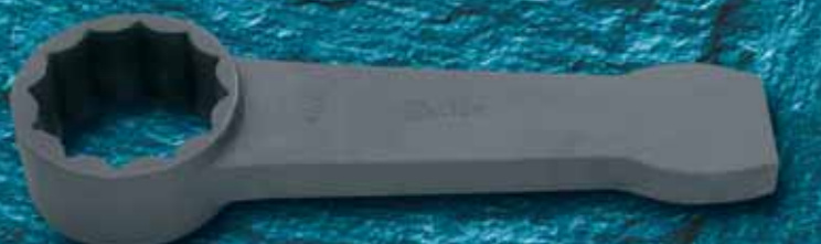
629PH (30-120 мм) Ударный ключ для крайне труднодоступных мест. Сверхтонкие и высокие стенки.

Сегодня Carl Walter является одним из ведущих немецких производителей инструмента, ассортимент которого насчитывает свыше 17 000 позиций.