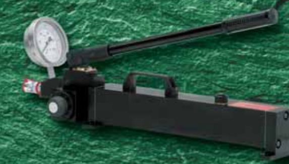
Ручные гидравлические насосы