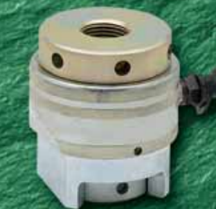
Boltmax tension Гидравлическое приспособление для предварительного натяжения болтов до M100