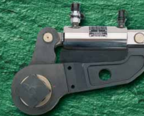
Boltmax classic Гидравлические динамометрические гайковёрты, до 100000 Нбм