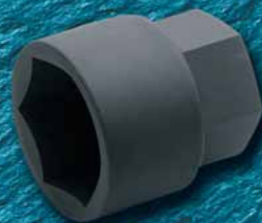
625PH (41-120 мм) Головка для ударных ключей, для утопленных болтов. Используется с 620PH

Этот опыт, объединённый с современными ноу-хау и новейшими технологиями, формирует базу для успешного позиционирования на рынке.