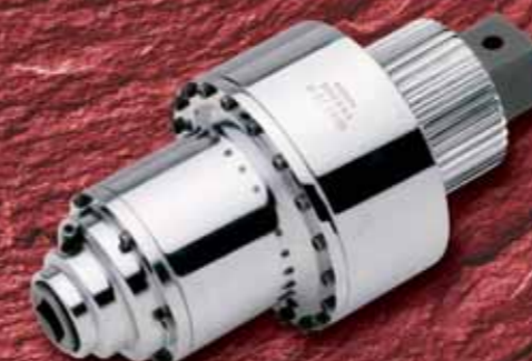
Мультипликаторы крутящего момента, до 16 000 Нбм