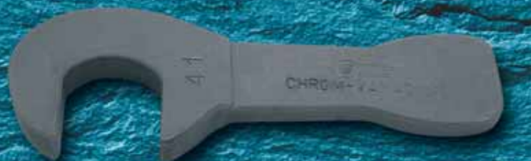
529SG (24-220 мм) Ударный рожковый ключ легированная сталь (AF1 1/16"-5")