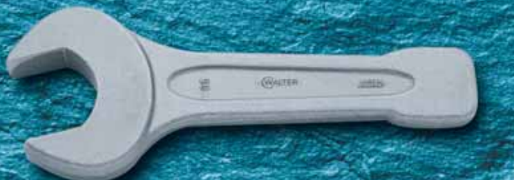
529SG (24-220 мм) Ударный рожковый ключ легированная сталь (AF1 1/16"-5")