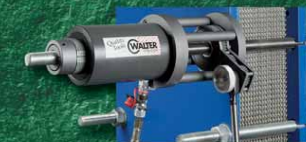
Boltmax XT, монтажная система для пластинчатых теплообменников, до M48