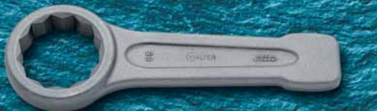
580SG (24-230 мм) Ударный накидной ключ легированная сталь (AF 1 1/16"-5")