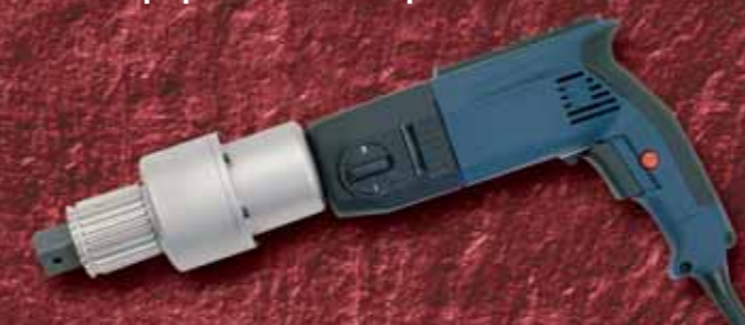
Электрические мультипликаторы крутящего момента, до 5000 Нбм