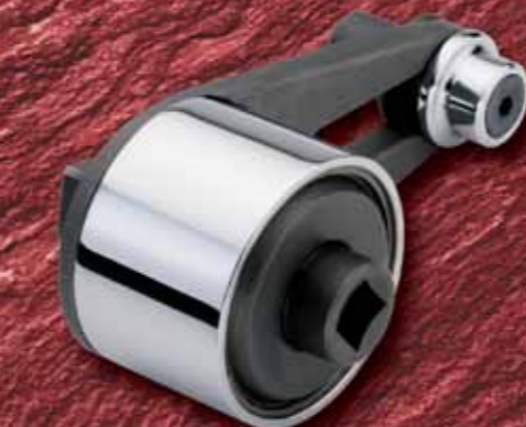
Мультипликаторы крутящего момента с интегрированной опорой