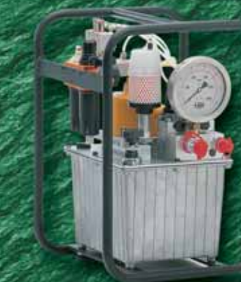
Гидравлические насосные станции (пневмоэлектрический привод)